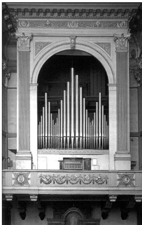
Organo SERASSI nella chiesa parrocchiale di Caprino Bergamasco (1850).

Il loro ben meritato successo è provato dal grande numero di pregevoli organi (circa un migliaio), dal plauso e favore raccolti ovunque, dai lusinghieri collaudi di celebri maestri, dai preziosi doni avuti, dai favori dei Principi, dagli ambiti incoraggiamenti di Imperatori e Papi, dai prestigiosi riconoscimenti legali, dai numerosi componimenti letterari a loro dedica-