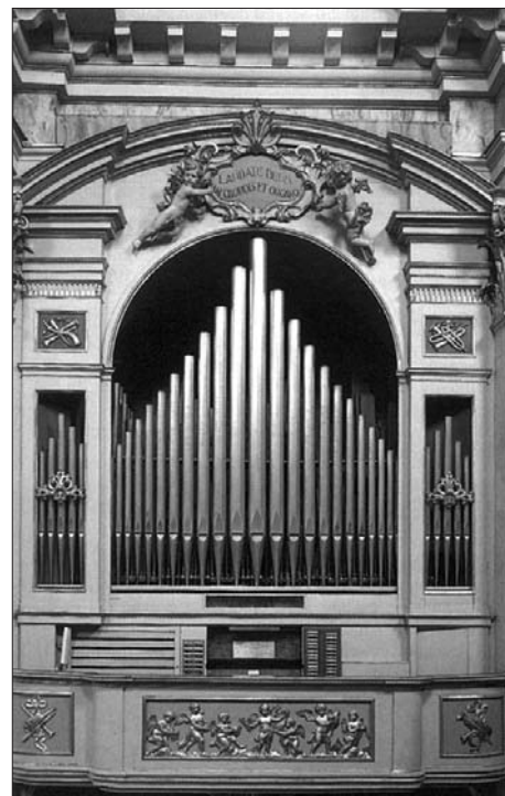
Organo SERASSI nella basilica di Sant'Alessandro della Croce in Bergamo (1860).

ti, oltre che dalla grande ricchezza patrimoniale raggiunta e dalla celebrità in tutta Italia delle loro officine.