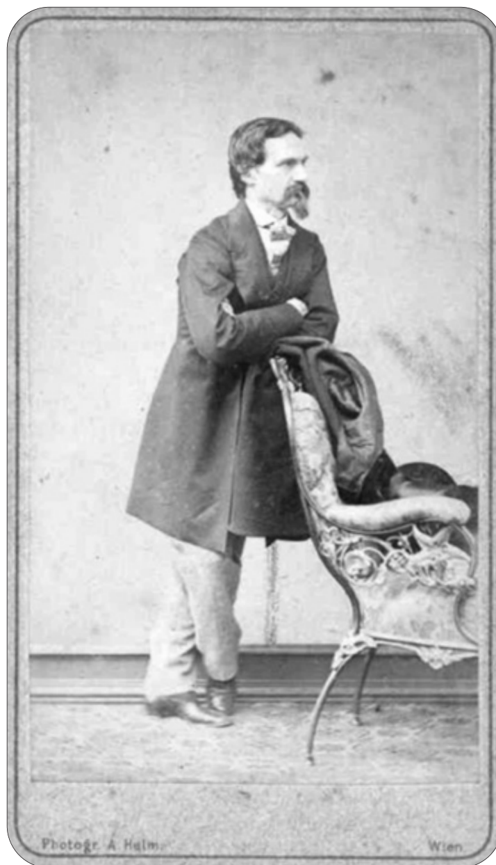
Fotografia di Alfredo Piatti scattata a Vienna dal fotografo Amand Helm. Essa risale, con ogni probabilità, all'inverno 1858/59, periodo nel quale il trentasettenne Piatti si esibì ripetutamente nella capitale asburgica come violoncellista (Carte Piatti-Arnal, Album fotografico, fot. n. 25).

esplicitamente, ma è desunta dall'inizio della lettera del giorno 11 ottobre 1779 ("Serenissimo Principe / Negli ultimi periodi di questa mia divota reggenza [...]". Qui il mittente si qualifica come Rettore e, dato che le lettere sono tutte datate da Bergamo, non può che essere Alessandro Antonio Barzizza che assommava in quegli anni le cariche di Podestà e di vice-Capitano nella nostra città. Gli argomenti trattati riguardano, in gran parte dei casi, questioni fiscali quali i rinnovi di privilegi daziari a singoli comuni o valli, ma anche delicate questioni di confine o l'acquisto di derrate alimentari per i pubblici depositi, la manutenzione delle strade. Il titolo di Registro Secreto indica il carattere riservato e non puramente burocratico della corrispondenza che merita senza dubbio una attenta lettura. Il Registro è consultabile alla segnatura AB 502.